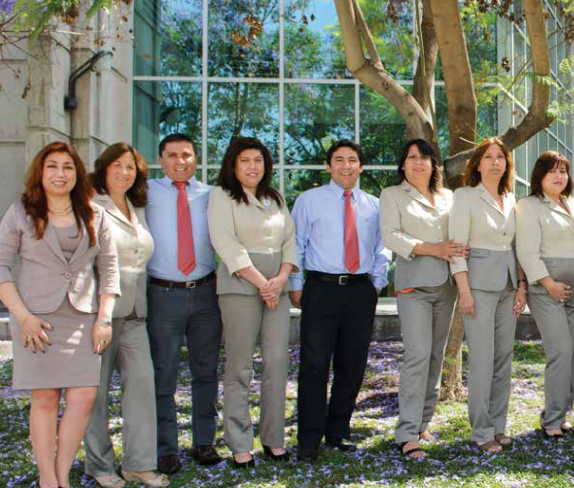
Equipo de ejecutivos del Programa Consalud Camina Contigo de Santiago, Concepción y V región.